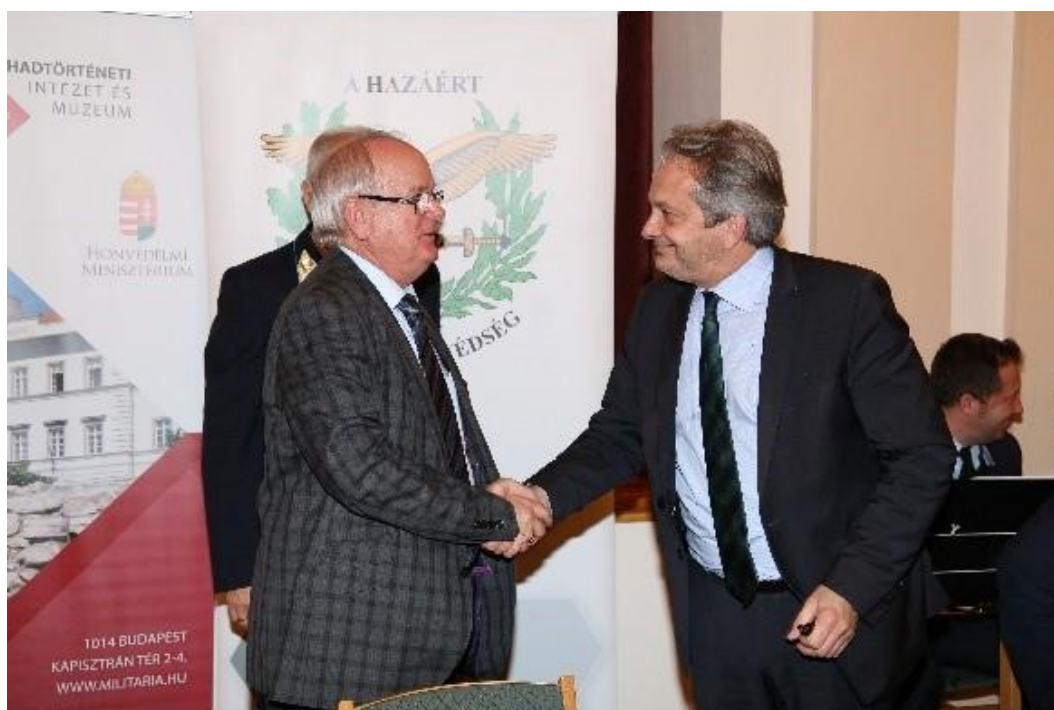
Vargha Tamás, Honvédelmi Minisztérium parlamenti államtitkár