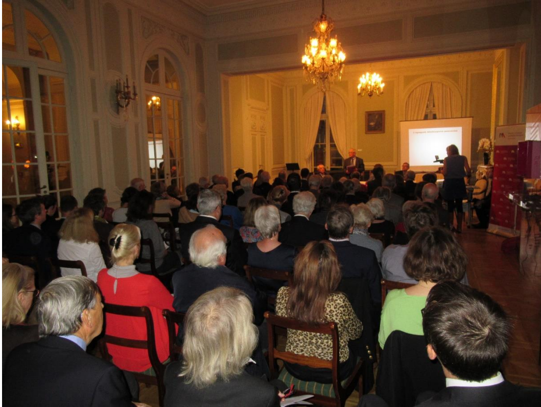
A konferencia helyszíne - Lengyel Intézet Díszterme