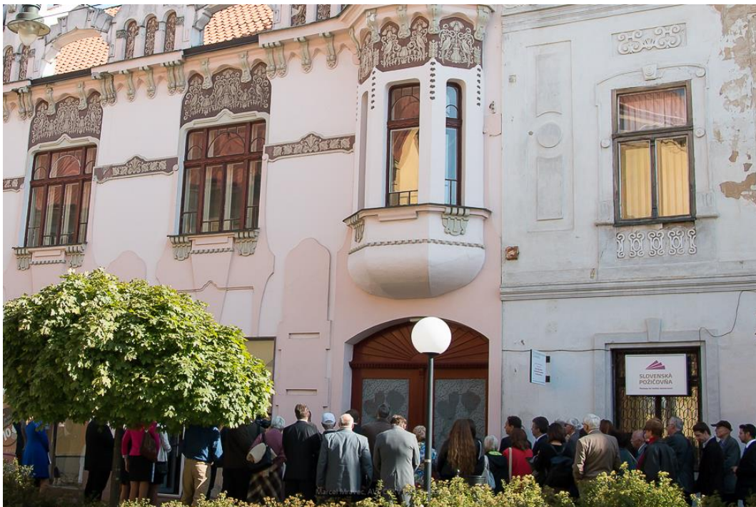
Maléter Pál szülőháza Eperjesen