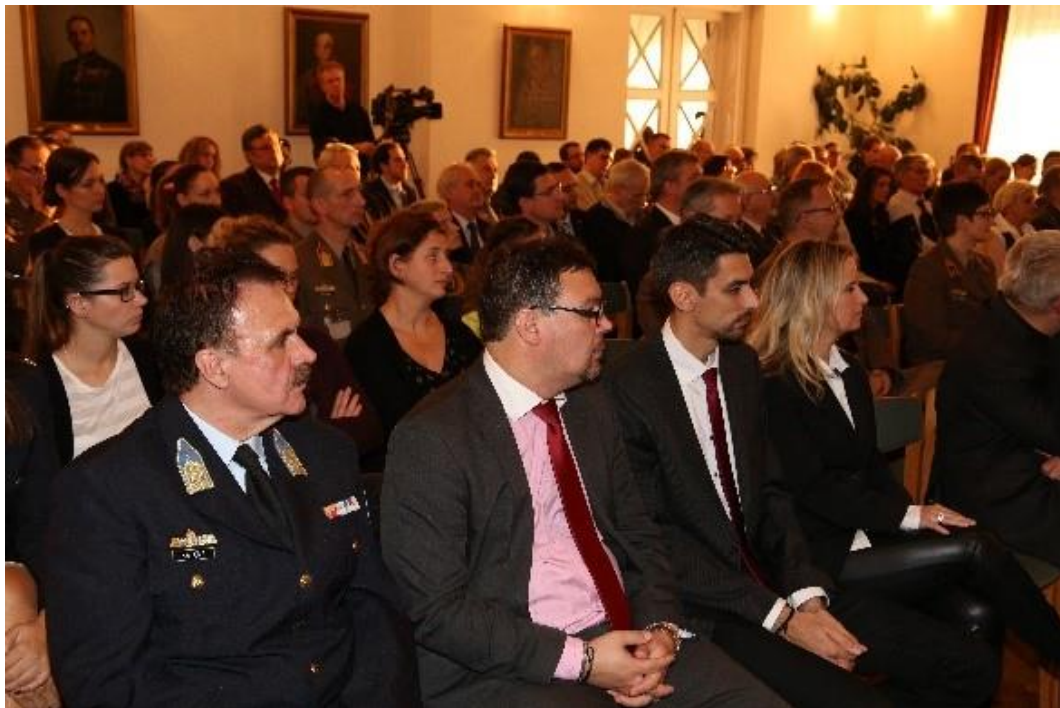
A bemutató helyszíne a Honvédelmi Minisztérium Hadtörténeti Intézet és Múzeum díszterme